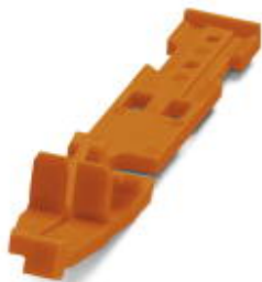
Pojistka, délka: 63,6 mm, šířka: 9,7 mm, počet pólů: 2, barva: oranžová

Upozorňujeme, že zde uvedené údaje pocházejí z online katalogu. Úplné informace a údaje naleznete v uživatelské dokumentaci. Platí všeobecné podmínky použití pro stahování z internetu. ( http://phoenixcontact.de/download )